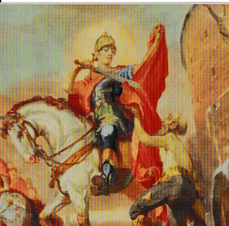
großes Deckenfresko St. Martin bei der Mantelteilung